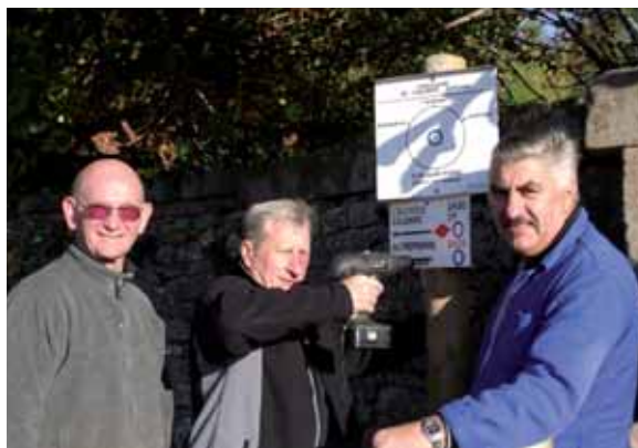
Les bénévoles du Club Vosgien à l'ouvrage

La réception officielle des travaux, par le comité consultatif tourisme de la CCV, devrait avoir lieu au printemps 2011.