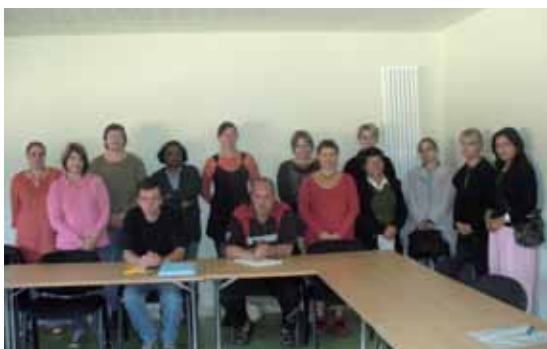
Les participants motivés par ce projet

Cette action a pris fin en décembre 2010.