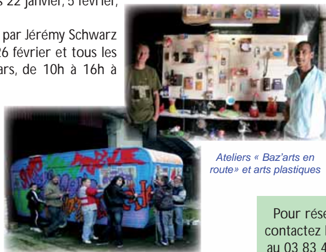
Ateliers « Baz'arts en route » et arts plastiques

- « Baz'arts en route » : trois caravanes-ateliers permettront d'aller à la rencontre des habitants et de susciter leur intérêt lors de manifestations (foires, vide-greniers, brocantes...). Vous pourrez y découvrir les objets réalisés, jouer avec les instruments fabriqués ou encore vous asseoir dans le salon de la Maison des Mots... Un atelier de décoration de ces caravanes a démarré en novembre 2010.