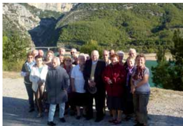
Les seniors, ravis de ce séjour.

Tous sont ravis de cette semaine de vacances et espèrent que l'opération sera reconduite l'an prochain.