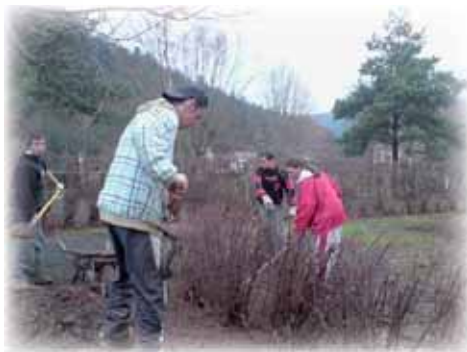
Les jeunes en plein travail

C'est dans ce cadre que les trois Communautés de Communes de l'Est Lunévillois (Vezouze, Haute-Vezouze et Badonvillois) ont réuni différents partenaires de leur territoire (associations, structures d'insertion, service Prévention du CG54...) pour réfléchir à la mise en place d'une action. La Mission Locale du Lunévillois a été choisie par le collectif pour être porteur du projet financé par l'Etat, le Conseil Général 54, le Conseil Régional de Lorraine, la CAF et les 3 communautés de communes.