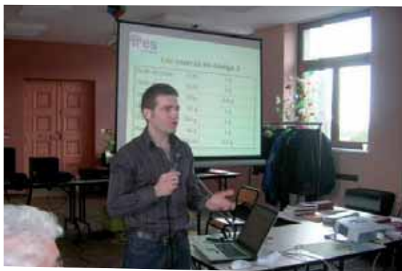
La nutrition expliquée aux seniors lors d'une conférence

Pourquoi ? Parce que la nutrition est un enjeu fondamental de la santé. Des solutions innovantes nous permettent actuellement de maintenir notre vitalité le plus longtemps possible.